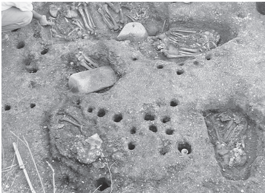
Fig. 1. Aspecto da escavação no Sambaqui Jabuticabeira-II, ilustrando uma área funerária com sepultamentos e buracos de estaca.

O material analisado foi resgatado de um buraco de estaca associado ao sepultamento 12 do Locus 1 (perfil 1.25, feição 1.25.4). Esta estrutura foi descrita como uma superfície com buracos de estacas, areia cinza e cinzas (Simões 2007).