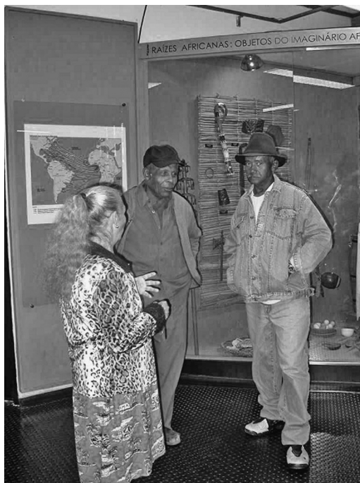
Fotos B, C, D. Visita à exposição Formas de Humanidade - Grupo da Comunidade São Remo.

Discutiram entre si sobre o processamento da mandioca, as diferenças regionais e o trabalho que executavam com seus parentes nas plantações e moinhos de farinha, alguns trabalhando desde os três ou quatro anos de idade o que nunca mais haviam realizado.