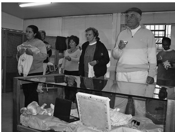
Fotos U, V. Exercícios de expressão corporal do grupo da Oficina da Memória.

O fotógrafo Wagner Souza e Silva propôs a elaboração de uma exposição itinerante, composta pelos painéis fotográficos de objetos dos participantes do grupo da São Remo. Para ele, estas fotos seriam expostas com o objetivo claro de