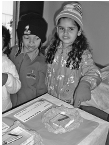
Fotos Q, R, R1, R2. Inauguração da exposição Objetos e Lembranças .