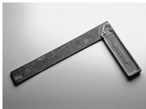
Fotos X1-X7. Painéis fotográficos da exposição itinerante Objetos e Lembranças .