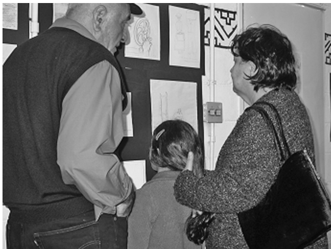
Inauguração da exposição Escavando a nossa Memória.