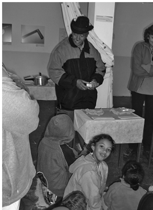
Fotos S, T. Crianças na exposição Objetos e Lembranças .