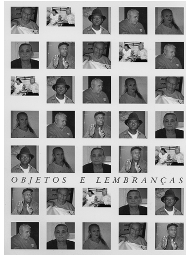
Convite/Cartaz da exposição Objetos e Lembranças.