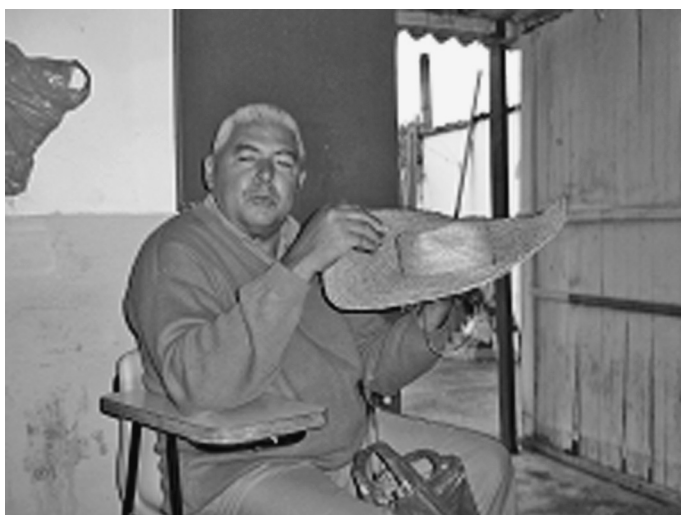
Fotos E, F. Objetos biográficos - Grupo da Comunidade São Remo.

de família, lembranças de infância, símbolos religiosos, presentes de pessoas significativas em