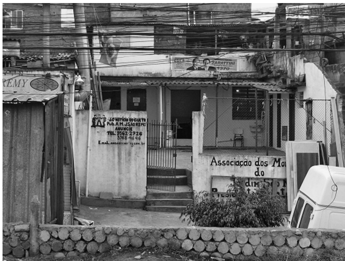
Foto A. Fachada da Associação de Moradores da Comunidade São Remo.

Constou da programação cultural deste grupo, uma visita ao MAE/USP. Fizeram-na justamente no dia da inauguração da exposição “Memória e Vivências”, montada por outros idosos de uma Oficina da Terceira Idade. Após este primeiro contato, foram feitas algumas reuniões conjuntas entre a educadora do MAE/USP e o grupo, surgindo a idéia de se realizar um projeto, sendo parceiras duas unidades da USP tão diversas, mas trabalhando juntas a partir do trabalho educativo desenvolvido por ambas (Foto A). 8