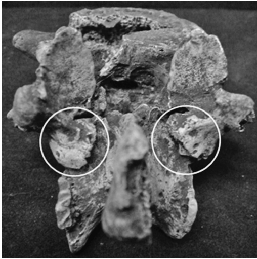
Fig. 1. Espondilólise bilateral completa em vértebra lombar, indivíduo masculino - Sambaqui Ilhote do Leste (RJ).