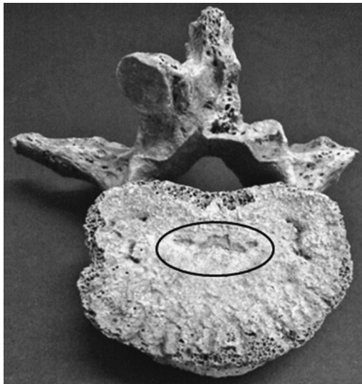
Fig. 2. Nódulo de Schmorl na superfície inferior do corpo de L3, indivíduo masculino - Sambaqui Zé Espinho (RJ).