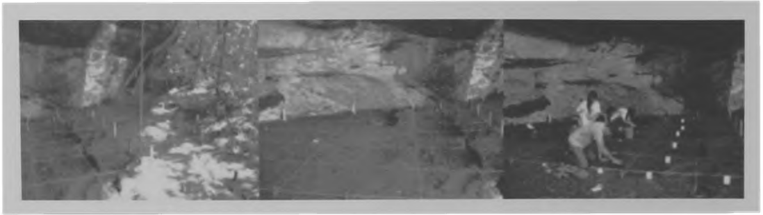
Fig. 2. Quadrícula e escavações no setor III.

Duas trincheiras também foram escavadas no setor I, entre as quadrículas 7D e 13D e 7E e 13E. Neste contexto, foram evidenciadas cinco manchas de fogueira e resgatados, em maior abundância com relação ao setor III, vestígios orgânicos e fragmentos de cerâmica (figura 3). Durante as atividades no local, também foram coletados fragmentos de carvão, já enviados para datação. As peças líticas perfizeram o maior número de vestígios arqueológicos do escopo da escavação.