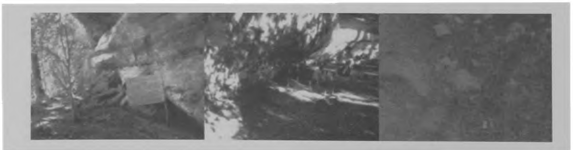
Fig. 3. Setor I - visão da entrada do abrigo, quadrícula e evidência de uma mancha de fogueira.