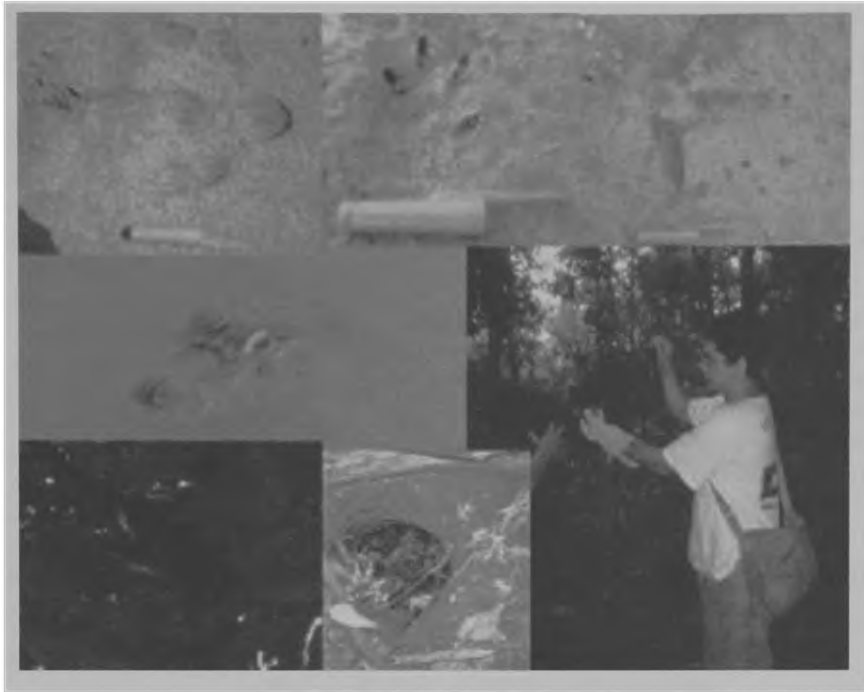
Fig. 4. Técnicas de levantamento faunístico: registro de pegadas e outros vestígios, observação direta de animais e captura por redes de neblina.

nos dados ilustrados nas tabelas 1 e 2. A fauna coletada é caracterizada por animais nativos dos biomas de Cerrado e Pantanal.