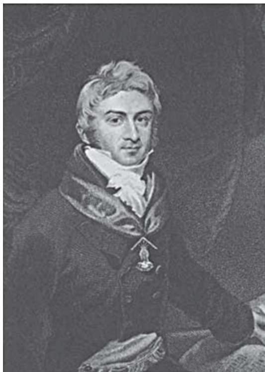
O jornalista Hipólito José da Costa em retrato de 1811

violência, e garantia a liberdade de culto. Tal postura funcionou como um ímã que atraía os que se sentiam oprimidos por sua fé, ou ausência de fé, entre os quais, empreendedores e intelectuais. Penn legou à colônia mais do que o próprio nome (Pensilvânia significa “a floresta de Penn”). Empenhado em promover o humanismo, colocou a Filadélfia – nome que, não por acaso, em sua origem grega, tem o sentido de “amor fraternal” – nos trilhos do que um historiador chamaria de “iluminismo revolucionário”.