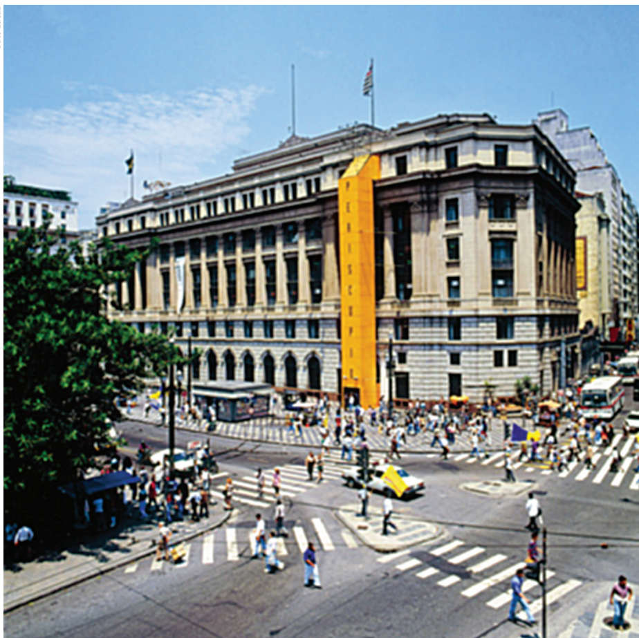
Guto Lacaz, Periscópio , 1995. Instalação, técnica mista