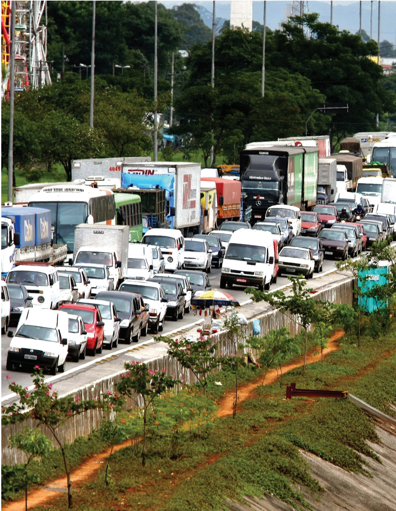
Eduardo Srur, PETS , 2008. Intervenção na margem do Rio Tietê