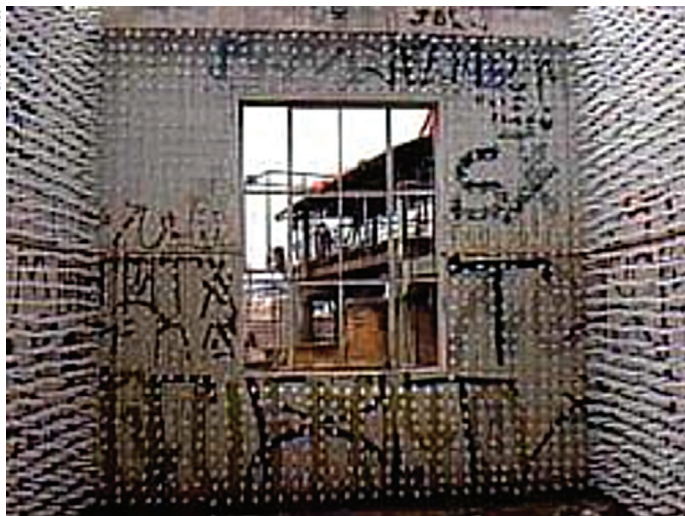
Cildo Meirelles, Sem título , 1997. Instalação com 7 mil seringas

escala gigantesca da megalópole. Guto Lacaz promoveu a integração entre os transeuntes da rua e os visitantes da exposição no segundo andar do edifício. Pelo periscópio, as pessoas na rua podiam ver o interior do edifício, enquanto os que estavam dentro podiam ver o movimento da rua.