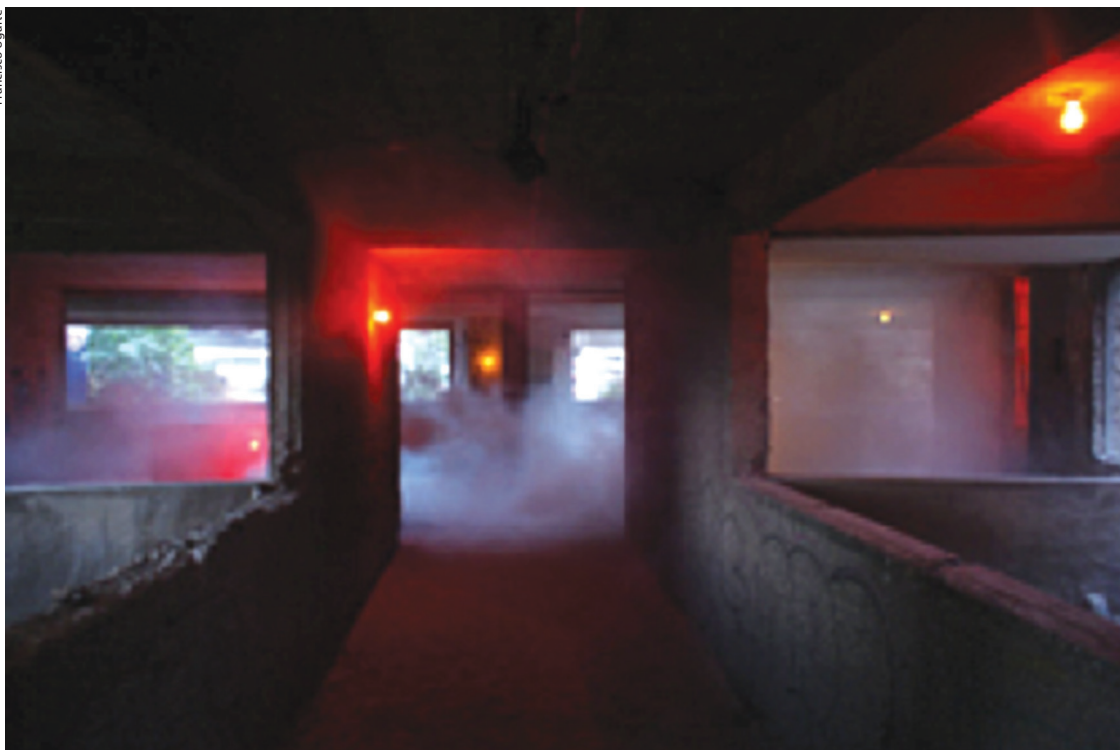
Francisco Ugarte, We are not afraid of ruins , 2012