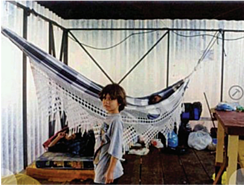
Vito Acconci, Sem título , 2002. Intervenção no Largo do Glicério

a primeira região a receber imigrantes e a industrialização na cidade. É a região mais populosa da megalópole, com grandes contrastes que resultam de um longo período de desinvestimento. Em grandes áreas abandonadas existem enormes favelas, comércio informal e ocupações ilegais. A proposta de Vito Acconci para essa área central famosa pelo grande contingente de pessoas sem teto não era alterá-la nem escondê-la, mas “aceitar” sua situação e criar ajustes para tornar a