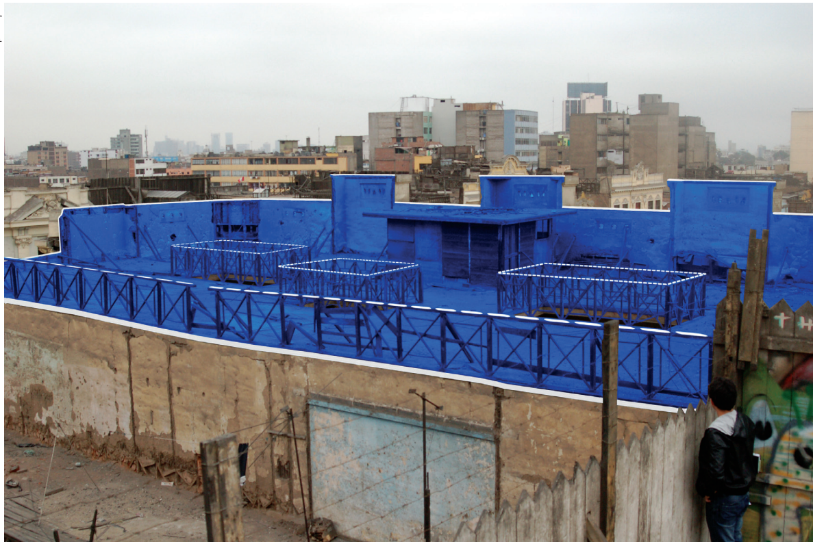
T.A.S. Blueprint , 2012