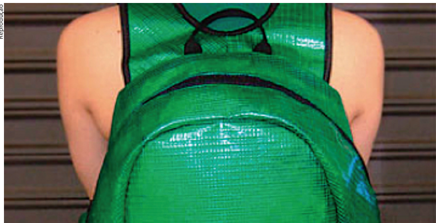
Mochila reciclada, desenhada por Jum Nakao