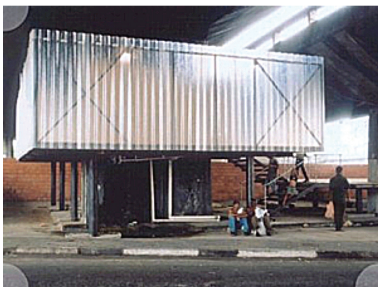
Vito Acconci, Sem título , 2002. Intervenção no Largo do Glicério

O Arte/Cidade – Zona Leste ocorreu em 2002, em uma área de aproximadamente 10 km 2 na Zona Leste de São Paulo,