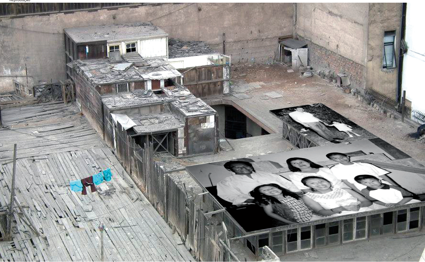
C.H.O.L.O., 2012. Instalação