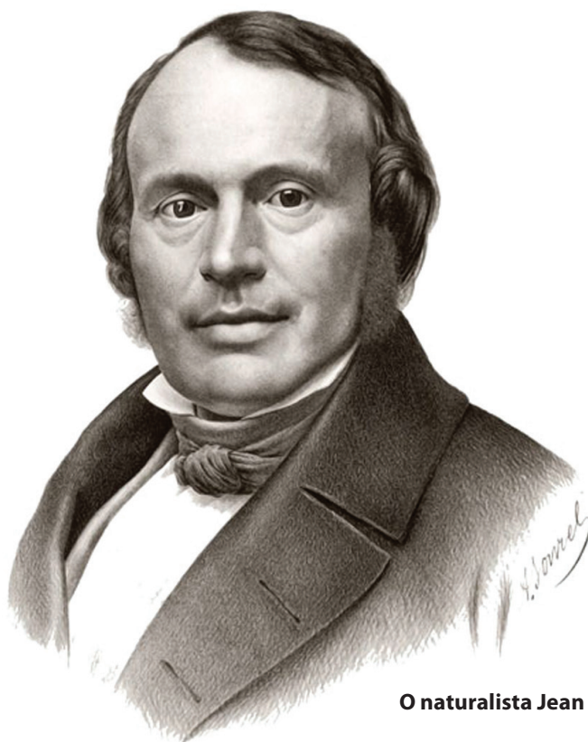
O naturalista Jean Louis Agassiz