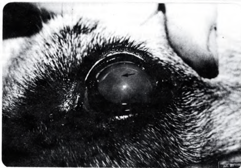
Fig. 1 – Forma jovem de D. immitis localizada na câmara anterior do globo ocular.

Com base nos estudos morfológicos por nós realizados e nos trabalhos supracitados, concluímos tratar-se de D. immitis , localizada erradicamente na câmara anterior do globo ocular de cão doméstico.