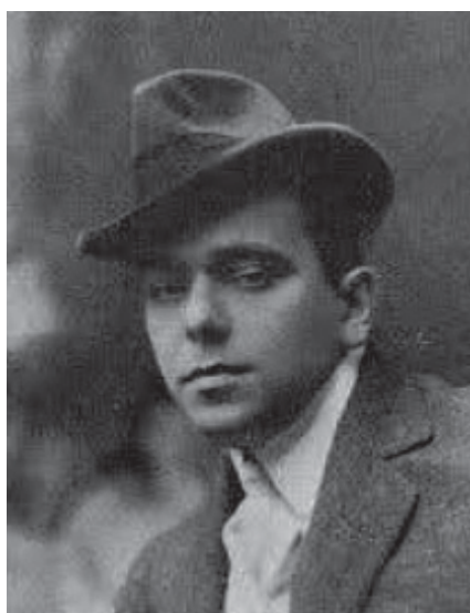
Figura 1 – Paulo Barreto (João do Rio), 1909. Ilustração Portuguesa , Lisboa, 25 de janeiro de 1909, p. 125

O grau de literalidade desses escritos, além de estar patenteado no estilo do destinador, confirma-se por meio de uma evidente ficcionalização, já que, embora assinando apenas duas das 66 cartas como João do Rio, Paulo Barreto constrói um personagem e encena situações onde se produz o homem de teatro.