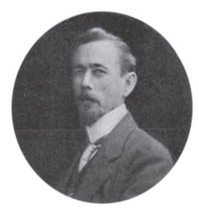
Figura 5 – Lauro Müller. Ilustração Portuguesa , Lisboa, 26 de fevereiro de 1912, p. 280

A pesquisa iconográfica que realizamos foi concebida como complementar à identificação e permitiu-nos oferecer ao leitor uma ideia mais precisa dos amigos, aliados mas, também, dos desafetos de Paulo Barreto e João de Barros.