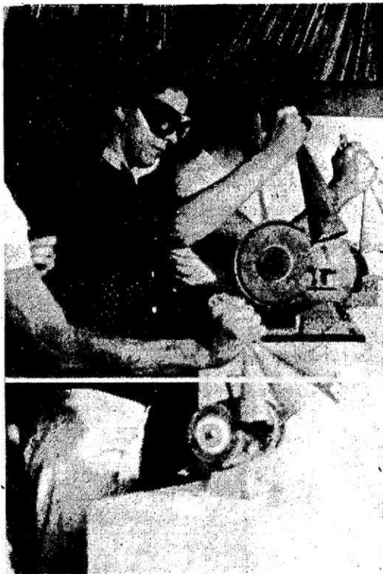
Tom Zé utiliza instrumentos dos operários

Figura 1 – Fotografia presente em matéria publicada sobre o lançamento do LP Correio da Estação do Brás .