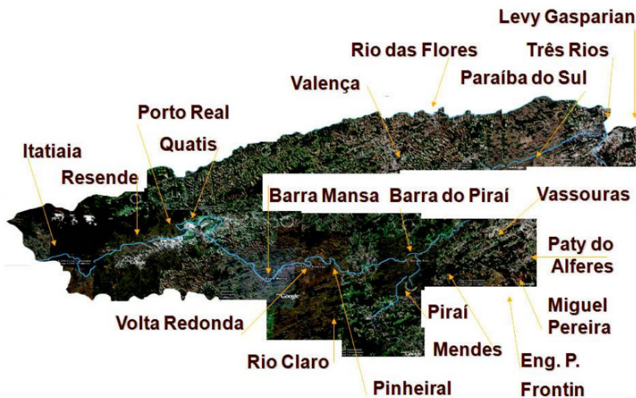
Figura 5 – Área de atuação do ETMVP.

A separação definitiva entre as gestões viria com a criação do Instituto Brasileiro de Museus (Ibram) em 2009. Posteriormente, o Escritório Técnico migraria para o Paço Municipal, cujo edifício é o antigo Palacete do Barão de Vassouras, que entrou em obras em 2020 20 ; assim, de modo provisório, as atividades técnicas foram instaladas na sede da Associação de Paroquianos de Vassouras (Asepava), na rua Barão de Massambará.