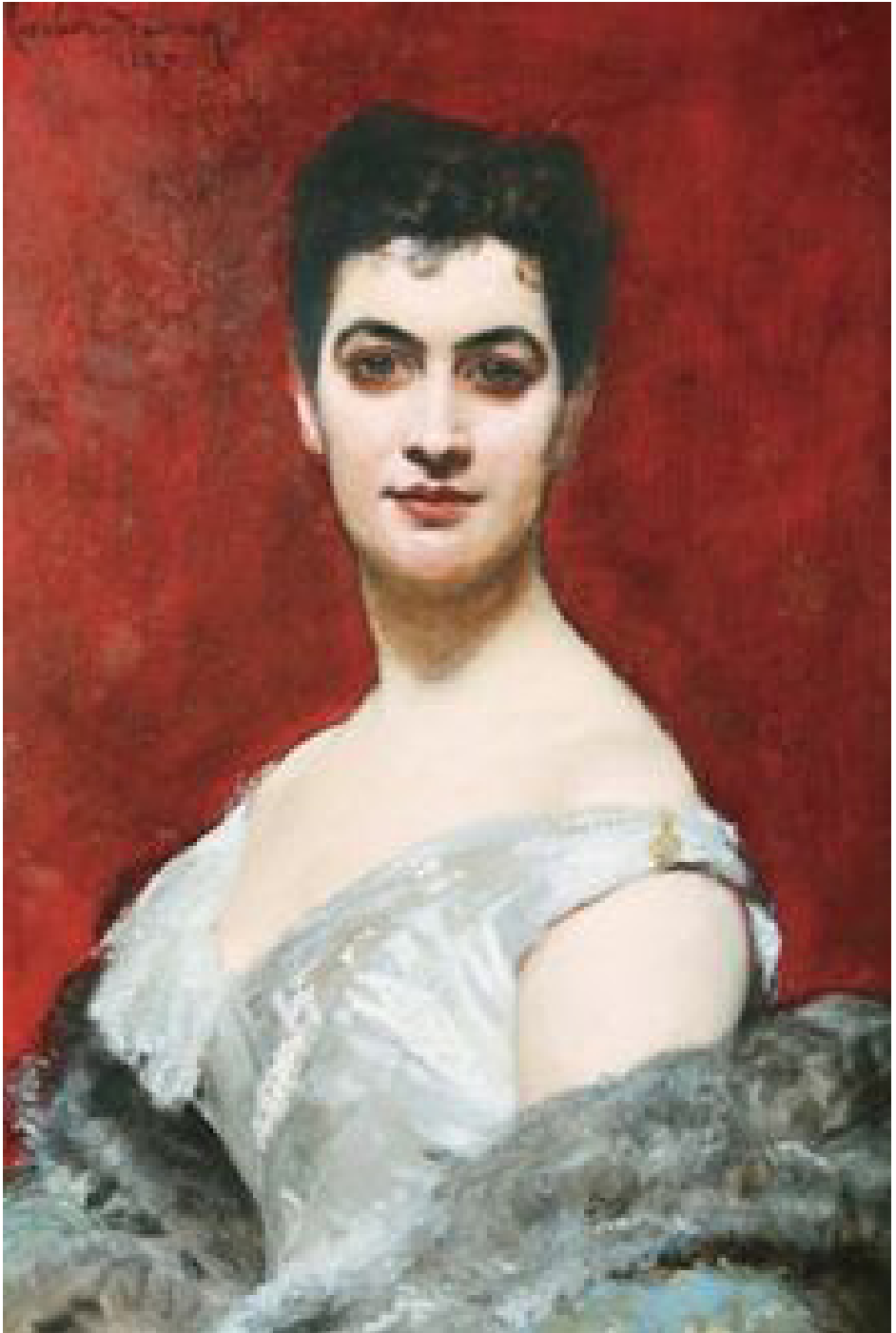
Figura 3 – Retrato de Eufrásia Teixeira Leite. Carolus Duran, óleo sobre tela, 81,5 x 63,3 cm, 1887. Museu Casa da Hera. Número de tombo MCH T 1066