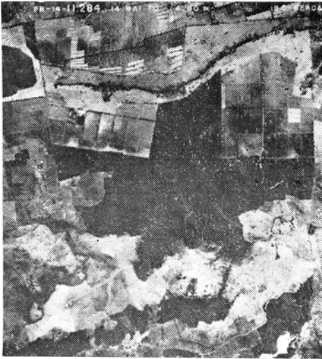
Fig. 1 — Foto aerofotogramétrica da floresta localizada na Fazenda Santa Helena, município de Londrina, Paraná.

boa luminosidade em seu interior. A floresta constitui ecossistema natural isolado pois seus limites são por um lado a cultura de café e por outro, campo de pastagem para bovinos (Fig. 1 — foto aerofotogramétrica). O método utilizado foi a armadilha do tipo Shannon, com isca luminosa. O horário de captura foi de 18:00 às 24:00 horas.