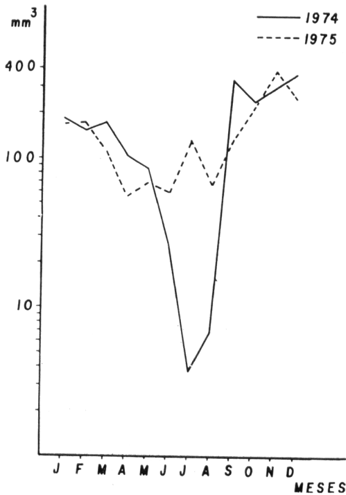
Fig. 3 — Precipitação mensal (mm 3 ) do município de Londrina ocorrida nos anos de 1974 e 1975.

Ps. whitmani , P. fischeri e P. pessoai uma vez que os mesmos estão implicados na transmissão da leishmaniose tegumentar, no Brasil. Se observarmos a Tabela e a Fig. 2, constatamos, através do método empregado, predominância absoluta de Ps. whitmani . Esta condição parece justificar-se pela característica silvestre essencial desenvolvida por esta espécie. Em área ecológica semelhante do Estado de São Paulo, embora em princípio de devastação, verificou-se que Ps. whitmani e Ps. intermedius alternam a predominância desta fauna (Forattini 6 , 1960). Quanto a P. fischeri , observamos menor densidade em relação ao Ps. whitmani . Segundo Forattini 5 (1973) esta espécie tem sido encontrada em baixa densidade nas florestas virgens. P. pessoai de hábito silvestre ocupa o posto inferior entre as três espécies.