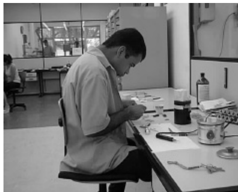
Figura 2 – A postura cervical estática no posto de trabalho de uma fábrica de jóias

Às vezes é necessário cortar o molde para estreitá-lo. O corte é feito com o pirógrafo e as pontas cortadas são coladas com parafina quente. A seguir, com ajuda de um estilete o trabalhador retira o excesso. Verifica se ficou torto, gira o molde, passa o estilete, assopra. Com uma espécie de esponja faz o acabamento procurando deixar a peça o mais limpa possível.