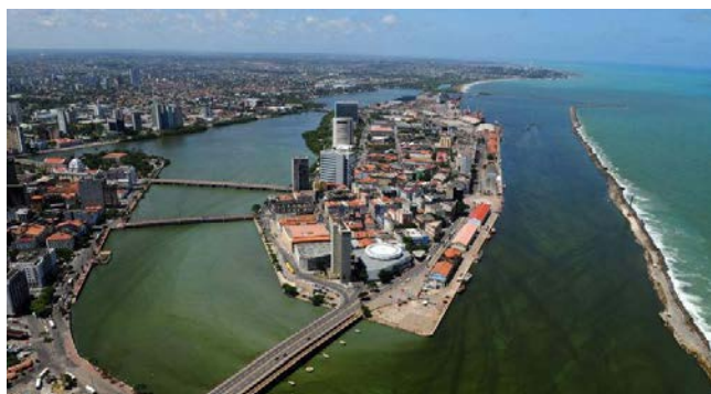
Figura 4: Cena do filme Aquarius sem as torres gêmeas.

imobiliária desenfreada, aos interesses econômicos de empreiteiras e do poder público, à desvalorização do patrimônio histórico, social e da memória da cidade do Recife, o cineasta não se fez de rogado ao responder a críticas sobre o “apagamento” de parte da paisagem real do bairro de São José, comentando: “Foi muita tentação. O filme é meu e quem manda nele sou eu” (FERREIRA, 2016).