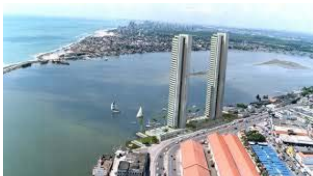
Figura 3: As “torres gêmeas” em Recife.

Góis, no Pina. A sequência mostra, em um plano aéreo, a Bacia do Pina, o Clube Cabanga e as redondezas. Nota-se, na sequência, que da paisagem foram excluídas as “torres gêmeas” – como são conhecidos dois edifícios gigantes símbolos do processo de verticalização da cidade, construídos pela empreiteira Moura Dubeux, beneficiados com o amparo à especulação imobiliária que há décadas vem tomando os bairros do Recife, impactando as paisagens naturais ou construídas pela história e protegidas pelo patrimônio cultural da cidade.