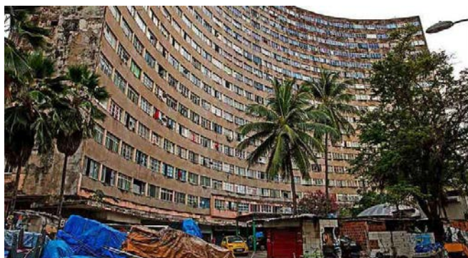
Figura 1: Edifício Holiday.

Construído em 1957, o Edifício Holiday, até 2019, abrigava cerca de 2 mil pessoas. Ícone da arquitetura modernista na cidade – imensa estrutura de concreto curvada, em forma de meia lua, com 17 andares e 476 apartamentos –, o prédio conta com pelo menos 30 estabelecimentos comerciais espalhados em seu pátio, no térreo, que servem aos moradores e à vizinhança. O imóvel é considerado um símbolo da expansão imobiliária na região da praia de Boa Viagem por estar no centro do território disputado pela elite econômica pernambucana.