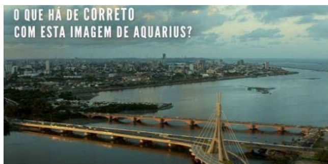
Figura 5: Imagem de Aquarius reproduzida por Kleber Mendonça Filho no Facebook.

Podemos pensar os filmes Deserto feliz e Aquarius como representações que são organizadas com o objetivo de, parafraseando Sarlo, se situarem entre “a realidade da cidade, a experiência de cidade e a ideia de cidade” (2014, p. 164). A mudança na paisagem do lugar explicitamente proposta no filme Aquarius é evidência das divisões existentes no contexto das relações entre as classes sociais média e alta em