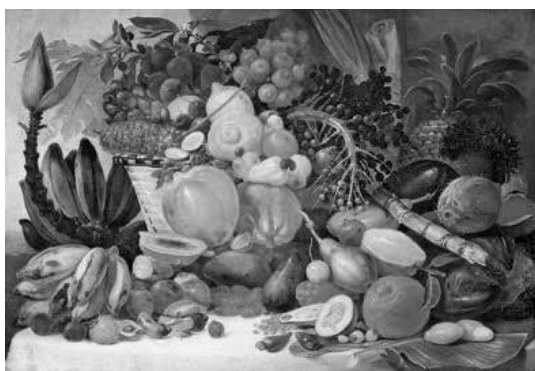
fig. 4 Debret, Natureza-morta com frutas do Novo Mundo , s.d., OST, 113 x 76 cm, Musée Magnin, Dijon

gem pitoresca e histórica ao Brasil fora enviada pelo pintor para o Instituto Histórico e Geográfico Brasileiro já no começo dos anos 1840. 15 Além disso, Debret fora professor da Academia de Artes. Portanto, não é absurdo supor que ex-alunos e professores da instituição tivessem acesso a exemplares de seu livro no mesmo período.