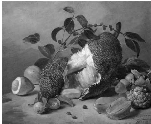
fig. 1 Agostinho José da Motta, Frutas , 1873, OST, 53,8 x 67 cm, Fundação Estudar, Pinacoteca

Na relativamente pequena tradição artística do Brasil, as mais antigas representações de natureza-morta, feitas com frutas tropicais, são da pena dos artistas que acompanharam os holandeses em sua investida à América portuguesa no século XVII. Dentre eles, destaca-se o pintor Albert Eckhout (c. 1610-65).