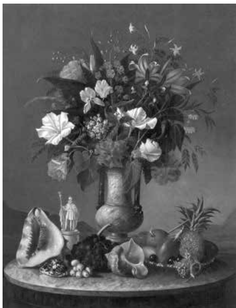
fig. 5 José dos Reis Carvalho, Natureza-morta com estatueta de d. Pedro II , 1841, OST, 100 x 85 cm, col. particular

estatueta de d. Pedro II (FIG. 5), de Reis Carvalho. Nessa obra de grande refinamento técnico, estão dispostos sobre uma mesa diversos elementos. O vaso agrupa flores europeias como o cravo a plantas tropicais, entre elas diversas orquídeas. Embaixo, o ananás, colocado em elegante bandeja de prata junto com outras frutas da terra, e o açaí, ainda em cacho, aparecem ao lado da estátua de Pedro II que, vestido em grande gala, é o objeto mais importante de toda a representação. Ao fundo, a baía de Guanabara, suavemente delineada, marca um lugar: a corte do Rio de Janeiro. E aqui, também a pintura de Reis Carvalho almejava enunciar discursos mais amplos. A natureza-morta sintetiza a ideia de que o império tropical é o território em que se unem o refinamento da cultura europeia e o exotismo encantador dos trópicos.