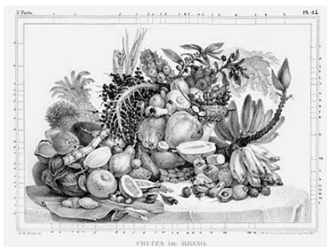
fig. 3 Debret, Frutas do Brasil (Fruits du Brésil) , gravura, in: Viagem pitoresca e histórica ao Brasil , prancha 24

A intenção de Debret ao representar as frutas é bastante pragmática: busca agrupar e descrever, de modo a tornar os elementos da natureza passíveis de serem utilizados pelo comércio ou pela medicina europeias. E aqui se percebe o quanto esse artista estava sintonizado com as formas de sensibilidade típicas da literatura de viagem do século XIX, em que a curiosidade científica vinha