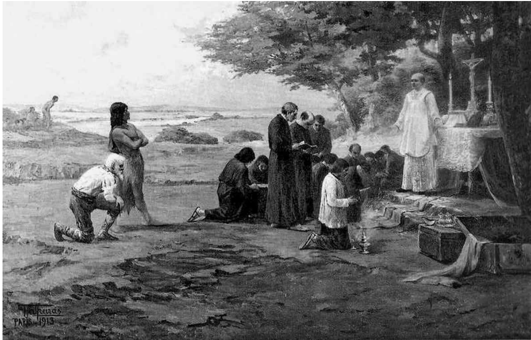
Antônio Parreiras. Fundação da cidade de São Paulo , 1913. São Paulo, Pinacoteca Municipal de São Paulo, 200 x 300 cm.

Opção semelhante pode ser analisada na obra de Antônio Parreiras (1860-1937), artista fluminense que, apesar de ter-se consagrado como paisagista oriundo da escola de George Grimm, 15 possui uma obra bastante diversificada, na qual se exercitou em vários gêneros tradicionalmente valorizados pelo campo acadêmico, como os nus, as paisagens e, notadamente, as obras de cunho histórico sobretudo a partir da proclamação da República. A partir de 1905, num intervalo de tempo que iria até os idos da década de 1920, o artista fluminense se torna um dos mais requisitados pintores de telas históricas da República, executando cerca de trinta obras de cunho histórico para os mais variados