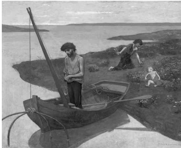
Pierre Puvis de Chavannes. Le Pauvre Pêcheur , 1881. Óleo sobre tela, 155,5 × 192,5 cm. Paris, Musée d'Orsay

o mais notável pintor da III República: à maestria do desenho ele acrescentava ainda a utilização de uma paleta cromaticamente rica, que incorporava a luminosidade e o efeito atmosférico concebido pelos impressionistas. Além disso, recuperara um gênero havia muito em desuso — o muralismo —, que se adaptava perfeitamente às demandas políticas do momento: o governo francês compreendia as pinturas como discursos visuais com funções claramente pedagógicas, destinadas à educação das massas, e, nesse sentido, a pintura mural era a saída perfeita. Com isso, Puvis de Chavannes se tornou uma espécie de pintor oficial do regime, recebendo diversas encomendas de grande vulto, como as incumbências de decorar o Panthéon, as paredes da Sorbonne e as do Hôtel de Ville.