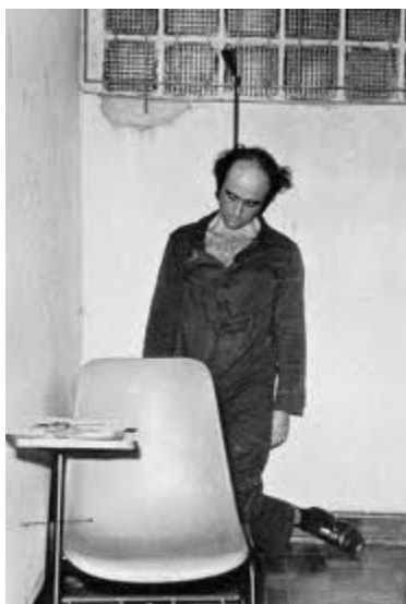
Figura 1 – Vladimir Herzog é assassinado no DOI-CODI

Fonte: Memorial da Resistência. Disponível em: < http://memorialdademocracia.com.br/publico/thumb/8233/740/440 >. Acesso em 16 dez. 2017.